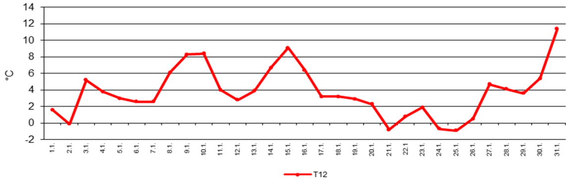
Temperatur: Tagesmaxima, Tagesminima, Tagesamplitude