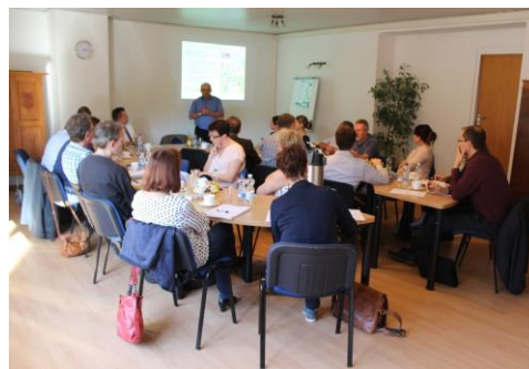
Auftaktveranstaltung zur PEK-Fortschreibung in Könnern

In den letzten Jahren wurden in umfangreichen Bearbeitungen für die einzelnen Teilgebiete unseres Naturparks Kulturlandschaftselemente und -ensembles erfasst. Als Abschluss dieser Erfassungen liegt nun in übersichtlicher Form die Zusammenfassende Darstellung und Bewertung der Kulturlandschaftselemente und -ensembles im Naturpark „Unteres Saaletal“ vor.