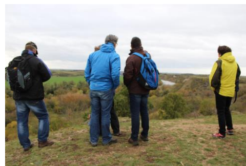
Exkursionsteilnehmer blicken über die „Brachwitzer Alpen“