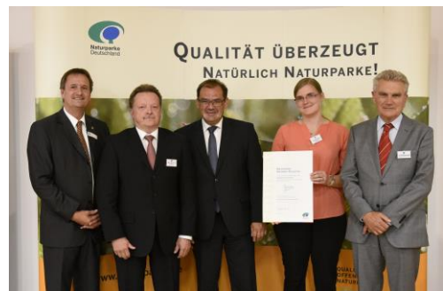
Übergabe der Urkunde