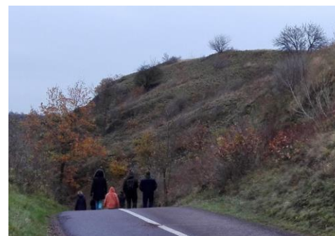
Studenten der Hochschule Anhalt unterwegs in der Porphyrylandschaft