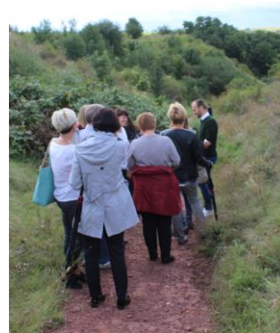
Im Nelbener Grund

Am 21. September wurde der Verband Naturpark "Unteres Saaletal" e.V. gemeinsam mit 22 weiteren Naturparks auf dem Deutschen Naturpark-Tag 2017 in Bad Belzig im Rahmen der "Qualitätsoffensive Naturparke" des VDN (Verband Deutscher Naturparke) ausgezeichnet. Hierzu hatte im Rahmen der Überprüfung und Beratung bereits am 12. und 13. Juni ein „Qualitäts-Scout“ unseren Naturpark bereist.