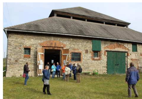
Wanderer am Schafstall in Grimschleben

Die diesjährige Naturpark-Herbstwanderung am 7. Oktober führte die Teilnehmer durch ein kulturhistorisch interessantes Gebiet im Norden des Naturparks. In der an Denkmalobjekten reichen Stadt Nienburg konnte die Klosterkirche besichtigt werden. Weitere interessante Objekte waren das ehemalige Schloss, die spätere Malzfabrik, der Marktplatz und die Nienburger Stadtkirche. Beeindruckend war auch der Schafstall in Grimschleben , wo eine fachkundige Führung stattfand. Die Besichtigung von Burgwall und Großsteingrab „Heringsberg“, Zeugen der einst großen Bedeutung des kleinen Nienburger Ortsteils, bildete einen würdigen Abschluss der Wanderung.