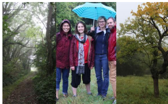
Impressionen von der Wanderung bei Beesenstedt

Die mittlerweile traditionelle Exkursion im Rahmen eines internationalen Tanz-Workshops auf Schloss Beesenstedt fand in diesem Jahr am 25. September statt. Wegen des Interesses, das trotz unbeständiger Wetterverhältnisse vorhanden war, wurde das Wandergebiet um Klochwitz diesmal mit wetterfester Kleidung und Regenschirm erkundet.