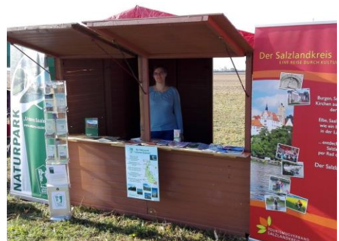
Infostand beim Bürgerfest