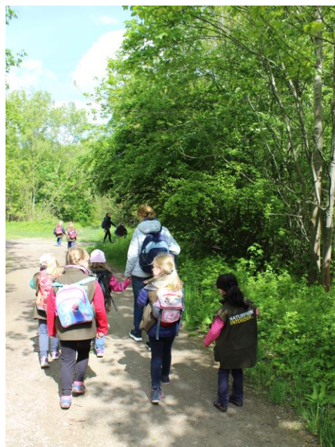
Gruppe der Kita Nesthäkchen unterwegs im Bernburger Auenwald