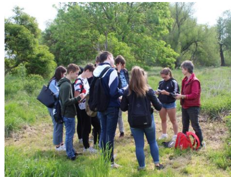
Ökologie-Praktikum in Neugattersleben