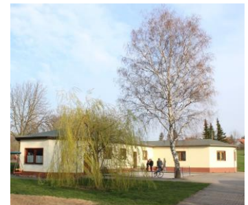
Sportlerheim in Dederstedt

Sehr geehrte Mitglieder und Freunde des Naturparks Unteres Saaletal, am 4. April fand in Dederstedt eine Informationsveranstaltung für die Bürger des Ortes statt. Neben Vertretern von Polizei und Energieversorgung war auch unser Naturpark aufgrund einer Einladung der Ortsbürgermeisterin an der Veranstaltung beteiligt. In einem Vortrag wurde die Planung zum Wanderwegenetz und das Kulturlandschaftskataster des Naturparks Unteres Saaletal mit besonderem Bezug zum Raum Dederstedt dargestellt. Großes Interesse fanden die Ausführungen zur Kulturlandschaftsgeschichte, da im Ort ein aktiver Heimatverein existiert.