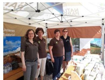
Naturpark-Infostand in Quedlinburg

Schöne Sommertage wünscht der Naturpark Unteres Saaletal