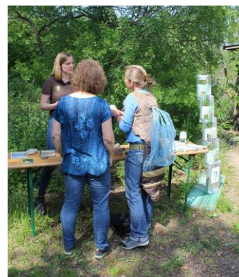
Naturpark-Infostand in Halle