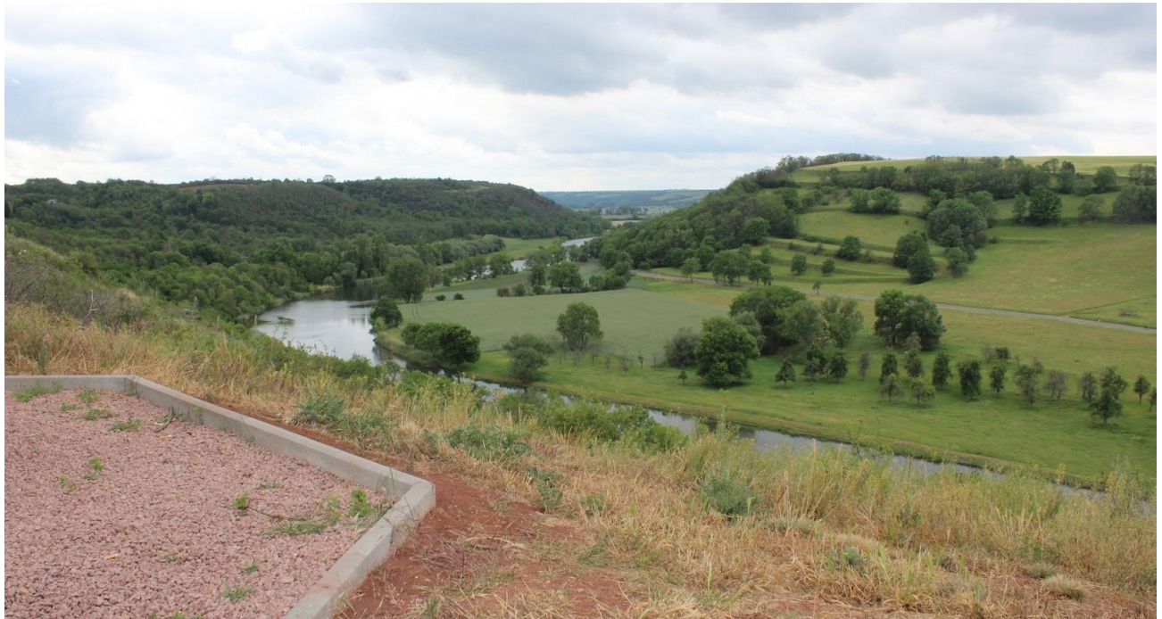
Blick von der zukünftigen Aussichtsplattform zum Panorama des Saaledurchbruchs