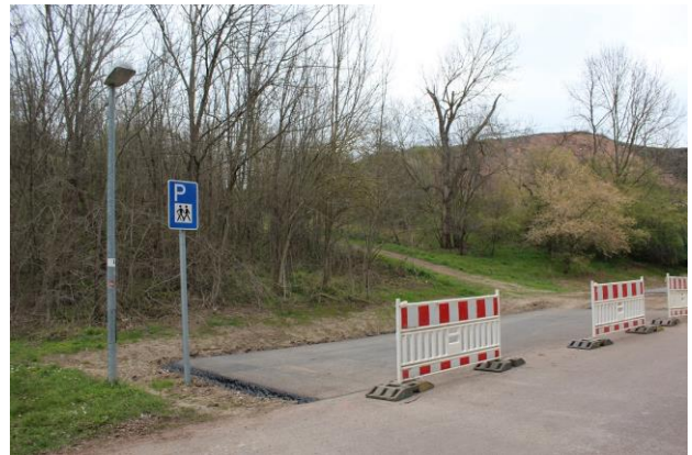
Wanderparkplatz bei Brachwitz in der Bauphase

In der Umsetzungsphase befindet sich das PEK-Projekt zur Gestaltung des Aussichtspunktes auf dem Saalberg in Rothenburg . Damit soll das Durchbruchstal im Herzen unseres Naturparks touristisch besser zugänglich und durch die Installation von Informations- und Aufenthaltselementen erlebbar gemacht werden.