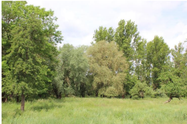
Areal für die Kopfweidenpflege bei Rothenburg