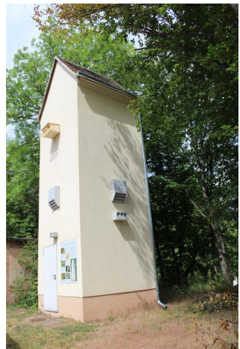
Zum Artenschutzhotel umgebautes Trafohaus in Rothenburg

Die Gestaltung des Trafohauses in Zellewitz wird in Kooperation mit dem Verein Artenschutz in Franken® sowie dem Naturhof Zellewitz und der Stadt Könnern als „ Stele der Biodiversität “ umgesetzt. Das Projekt ist das erste in diesem Rahmen realisierte Projekt in Sachsen-Anhalt. Ein weiteres ist für den Trafoturm in Wils (Gemeinde Salzatal) beantragt.