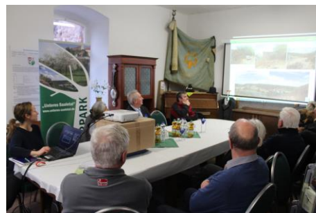
Informationsveranstaltung in Rothenburg

Schöne Frühlingstage wünscht der Naturpark Unteres Saaletal