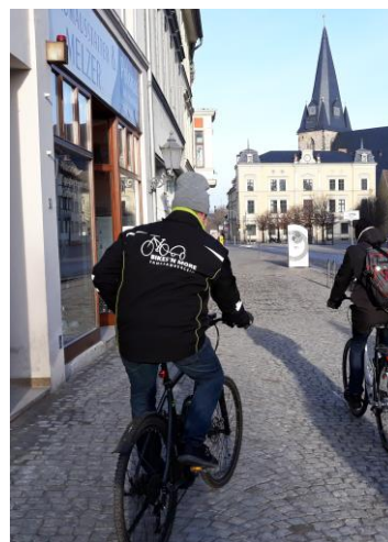
Start der gemeinsamen Befahrung

Am 14. März stellte der Naturpark auf einer Informationsveranstaltung sein neues Projekt „Aussichtspunkt Saale-durchbruchstal bei Rothenburg“ vor. Zu diesem Anlass waren Interessenten in das Museum in der „Alten Schule“ in Rothenburg eingeladen worden. Die Veranstaltung, auf der die Planung zur Gestaltung eines Aussichtspunktes auf dem Saalberg in Rothenburg vorgestellt wurde, war sehr gut besucht. Die Räumlichkeiten hatte uns dankenswerterweise der Verein 500 Jahre Industriegeschichte Rothenburg a. d. Saale e.V. zur Verfügung gestellt.