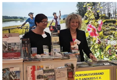
Infostand auf der ITB in Berlin